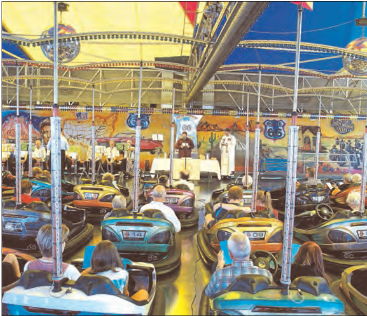
Ein fester Termin auf dem Rudolstädter Vogelschießen ist der Schautellergottesdienst am letzten Sonntag des Rummels.