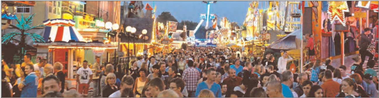
Rudolstädter Vogelschießen bedeutet das friedliche Miteinander von Generationen. Einfach Rummelspaß für alle.