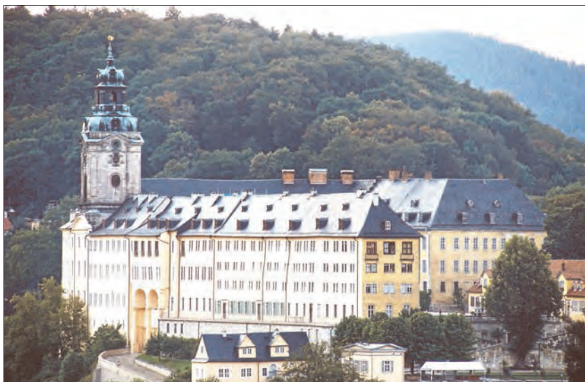
Die Hochfahrögeschäfte auf dem Rudolstädter Vogelschießen bieten den Gästen auch einen einmaligen Rundblick über die Region. Hier auf die Heidecksburg.