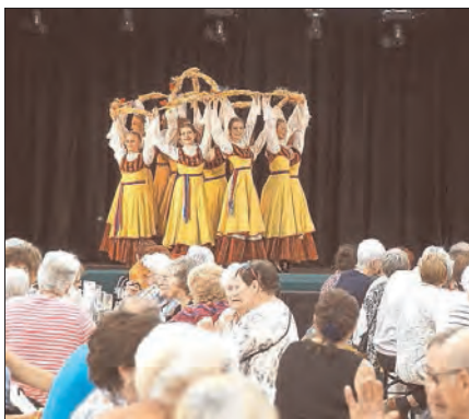
Kulturprogramm im Festzelt zum Seniorennachmittag. Dieser findet in diesem Jahr am Dienstag statt.