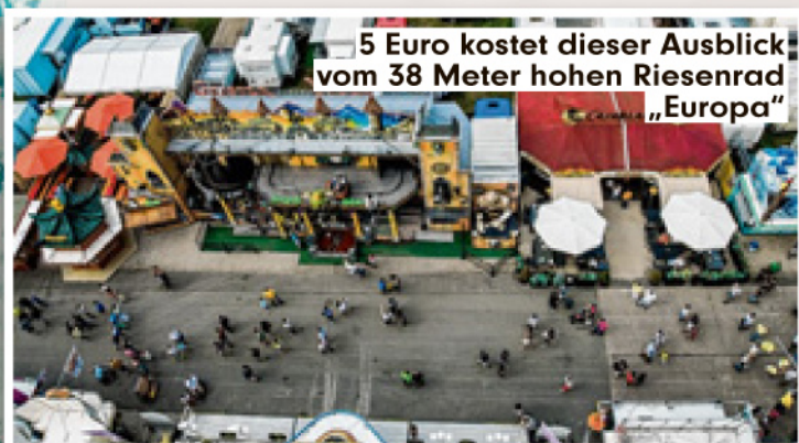
BILD MACHT AUF DEM RUDOLSTÄDTER VOGEL-SCHIESSEN DEN TEST

5 Euro kostet dieser Ausblick vom 38 Meter hohen Riesenrad „Europa“