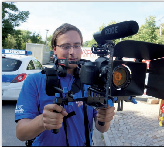
Vom 16. bis 26. August berichtet das Filmteam der „Drehmomente“ vom Rummeltreiben.

Mit der Filmkamera auf dem Festplatz unterwegs