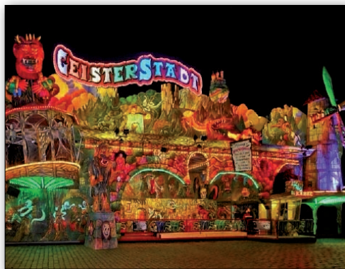
Geisterstadt. Die Fellerhoff'sche Geisterstadt setzt neue Maßstäbe in der Kultur des Erschreckens. Die Gäste tauchen in eine einmalige Welt der Gespenster, des gruseligen Sounds.