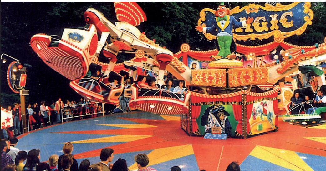
Wir freuen uns auf Ihren Besuch