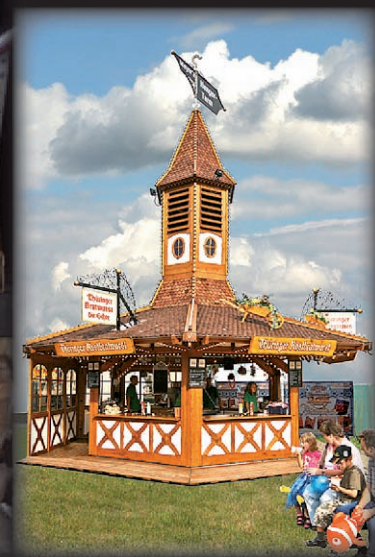
Hungerturm wieder die beliebten Bratwürste vom Rost - Rudolstädter Schlachthof-Spezialitäten

Meyer & Sohn GbR • Tel. 0172/351 32 28 • info@schausteller25.de www.fun-on-tour.de • www.schausteller25.de