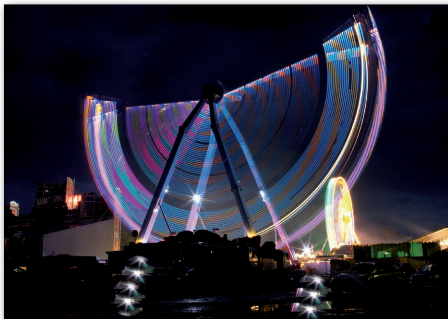
Stimmungen und Momente, die man gerne als Fotograf festhält.