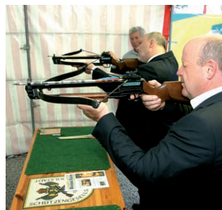
Die Schützentradition wird heute noch bewahrt.

„Den Vogel abgeschossen. Das Rudolstädter Vogelschießen, eine lange Geschichte.“ In der Pressemeldung von Deutschlandradio Kultur heißt es: „Große Volksfeste heißen Bremer Freimarkt, Hamburger Dom, Cannstädter Wasen in Stuttgart, Münchner Oktoberfest, Pützchens Markt in Bonn - und Rudolstädter Vogelschießen.