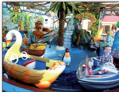
Die lustige Seefahrt. Die kleinen Gäste können auf dem Karussell von P. & C. Müller auf große Fahrt gehen. Dabei kommen sie an der Piratenbucht und dem singenden Seeräuber vorbei.