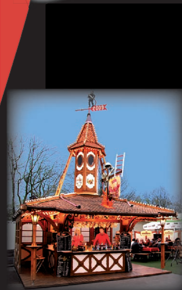
Löschurm zum 3. Mal in Rudolstadt dabei